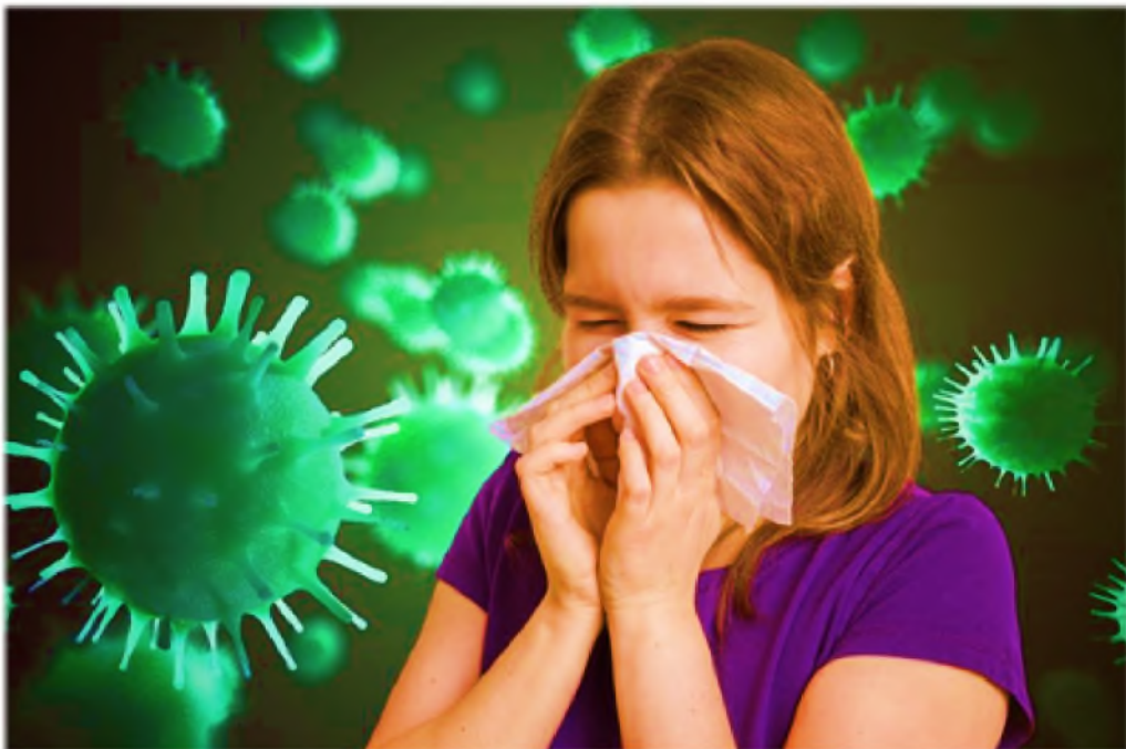
Как не заразиться