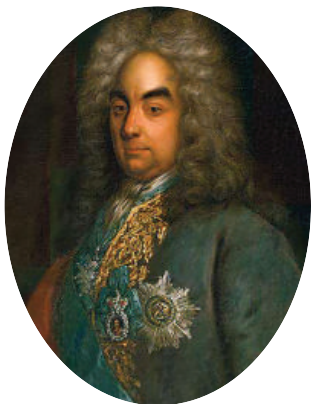
Петр Андреевич Толстой