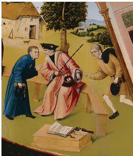
Фрагмент «Алчность» картины Иеронима Босха «Семь смертных грехов»

Рассматривая участников коррупции на примере взяточничества, стоит отметить, что в коррупционном процессе всегда участвуют две стороны. Одна сторона — это взяткополучатель (подкупаемый). Вторая сторона — это взяткодатель (осуществляющий подкуп). Также в процессе может участвовать и третья сторона — посредник.